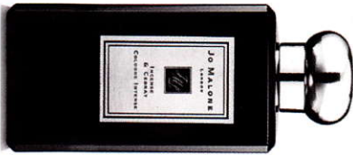
Jo Malone Cologne Intense Incense & Cedrat 100 ml € 120