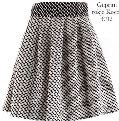
Geprint rokje Kocca € 92