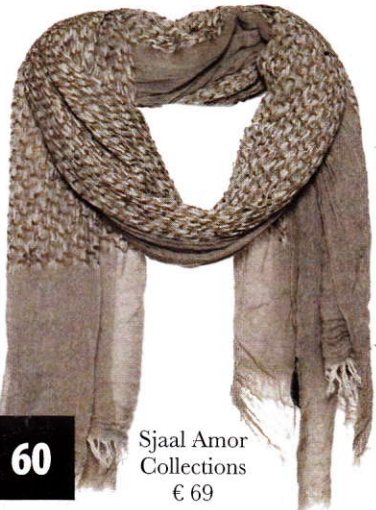
Sjaal Amor Collections € 69