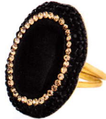
Ring met Swarovski Ana Dyla € 169,95