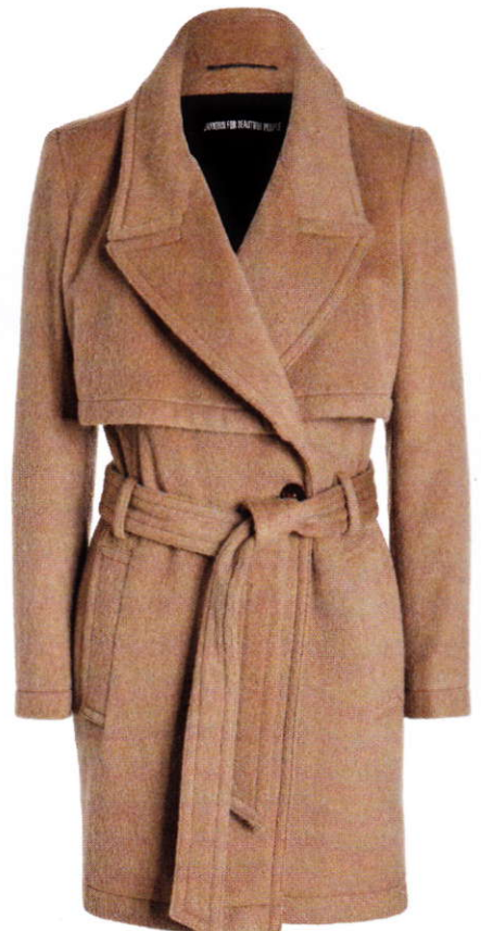
Camel wollen jas Drykorn € 149,99