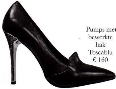
Pumps met bewerkte hak Toscablu € 160