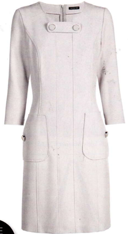
Cocktailjurk ijswit Caroline Biss € 215