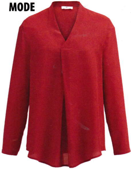
Opvallende blouse Peter Hahn € 165,95