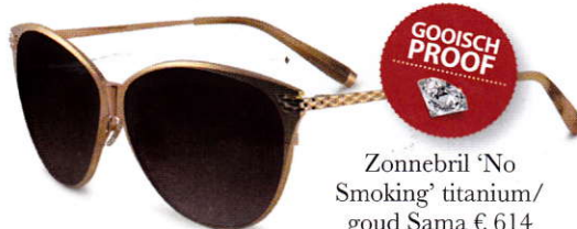
Zonnebril 'No Smoking' titanium/goud Sama € 614