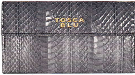
Snake print tas Toscablu €103