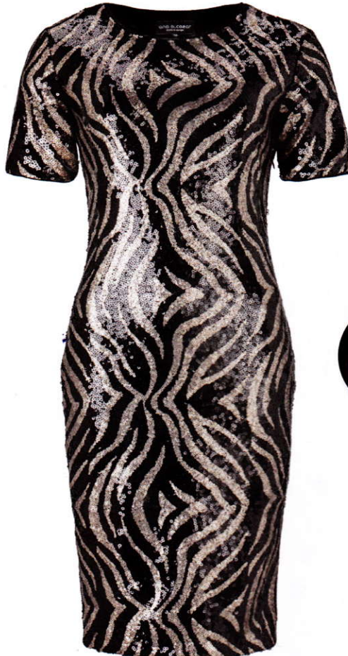
Vip-jurkje Ana Alcazar € 239