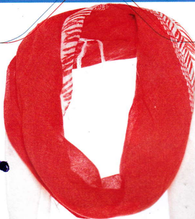
Sjaal € 39 (Amor Collections)