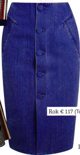
Rok € 117 (Topshop)