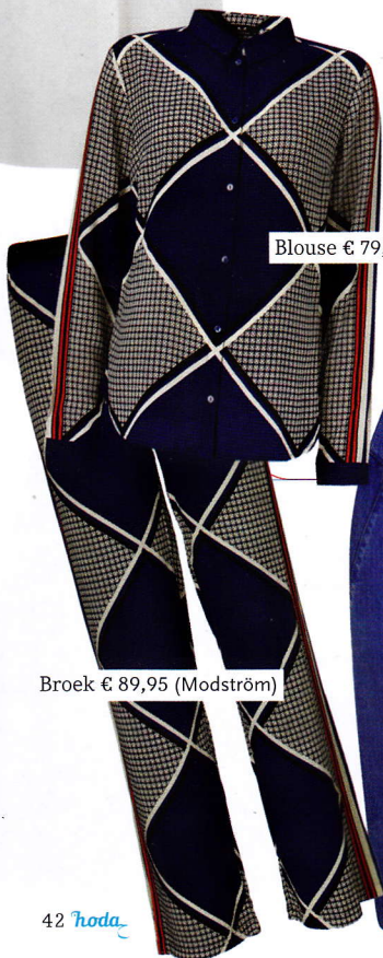
Blouse € 79,95 (Modström)