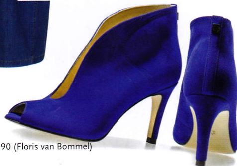
Pumps € 209,90 (Floris van Bommel)