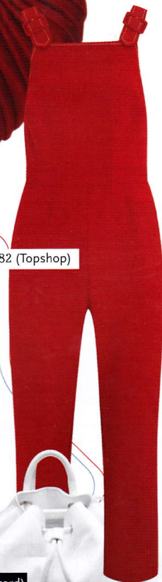
Jumpsuit € 82 (Topshop)