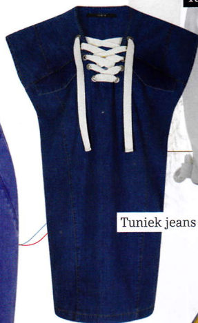
Tuniek jeans € 169,95 (SET)