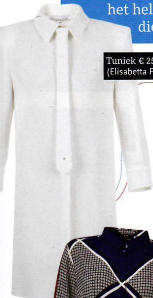
Tuniek € 259 (Elisabetta Franchi)

Bij rood-wit-blauw denk je misschien eerder aan de Nederlandse vlag of voetbalsupporters bij het WK, dan aan een geweldige nieuwe outfit. Toch zijn deze kleuren het helemaal dit seizoen. Rood-wit-blauw, de kleuren die perfect met elkaar te combineren zijn.