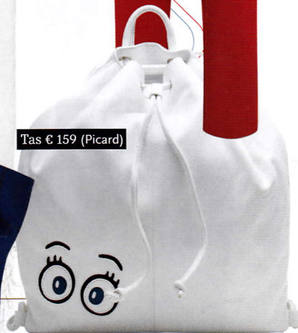
Tas € 159 (Picard)