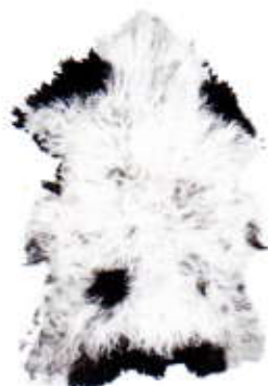
Vacht SCOTCH COLLECTABLES € 199,95