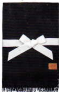
Plaid UGG HOME € 130,-