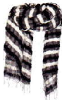
Sjaal AMOR COLLECTIONS € 109,-