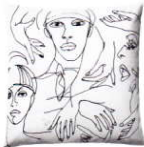
Kussen H&M HOME € 9,99