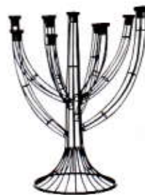
Kandelaar DR WONEN via 9straatjesonline € 169,-