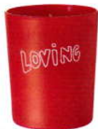
Geurkaars BELLA FREUD PARFUM via net-a-porter € 50,-