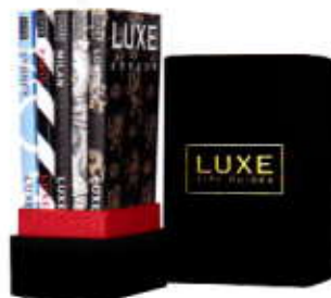
Reisboekjes LUXE CITY GUIDES via net-a-porter € 45,-