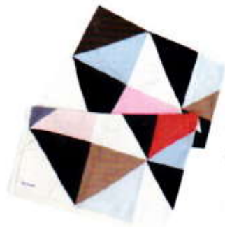
Plaid ANNILZ via 9straatjesonline € 336,-