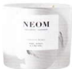
Grote geurkaars NEOM ORGANICS € 54,-