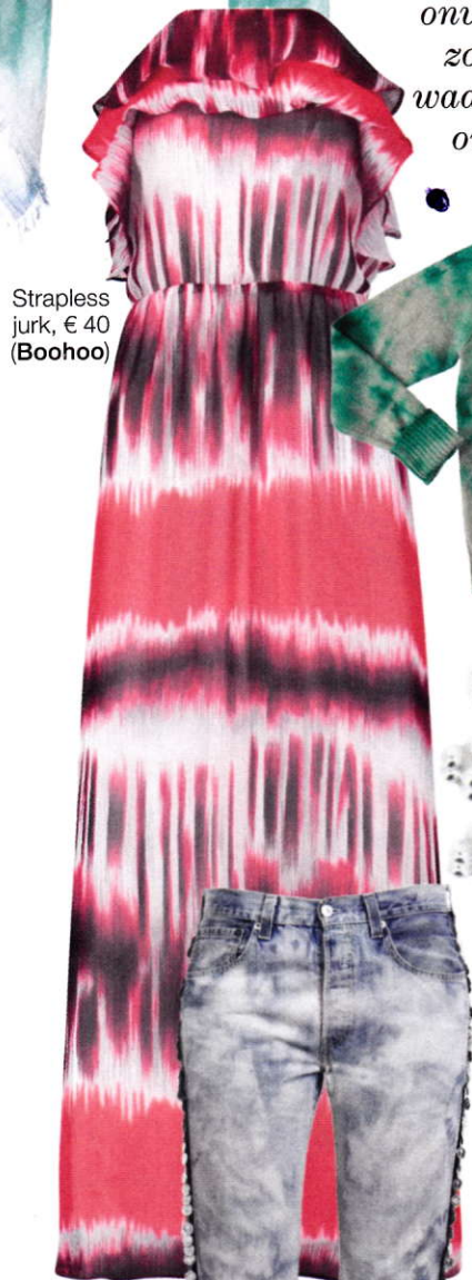
Strapless jurk, € 40 (Boohoo)