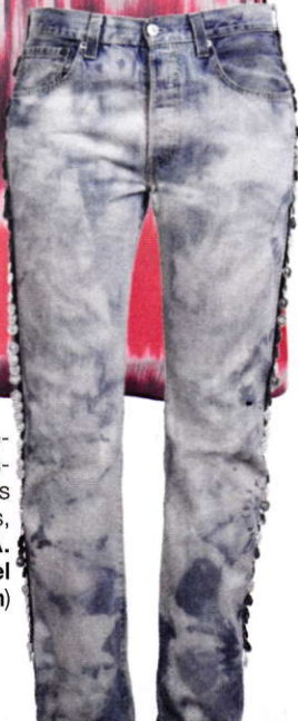
Vintage gebleekte Levi's-jeans met bies van muntjes, € 89,95 (B.L.A. Black Label Amsterdam)