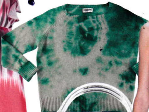
Trui, € 345 (Essentiel)