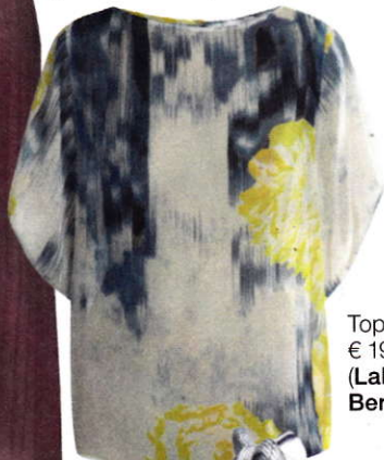
Top, € 198 (Lala Berlin)