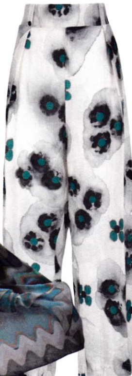
Hogetaillebroek, € 254 (Manila Grace)