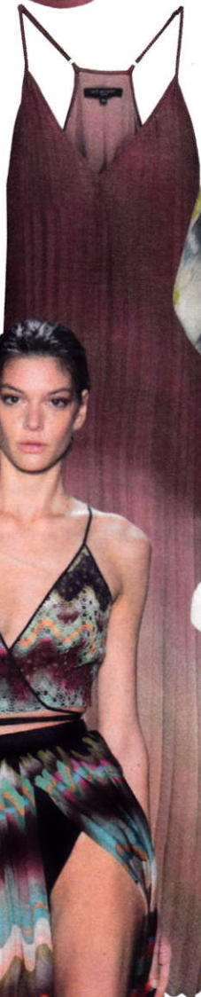
Dip-dye plissé jurk, € 150 (Ilse Jacobsen)