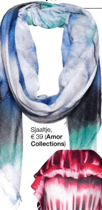
Sjaaltje, € 39 (Amor Collections)

Een losse (heren)broek, no doubt, want verrassend cool en onverwacht. Of een anorakje, zoals gezien bij Valentino, waarmee de meest eenvoudige outfits toch on trend zijn.