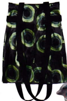
Zijden tas, € 550 (Acne Studios)