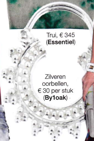
Zilveren oorbellen, € 30 per stuk (By1oak)