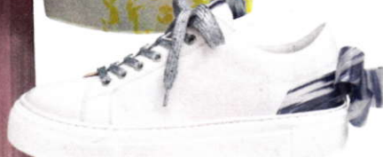
Leren sneaker met plexiglazen strik, € 235 (AGL)